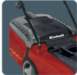
große Fangbox 43 Liter