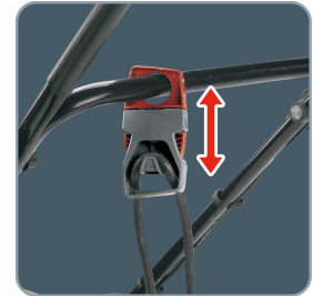
klappbarer Führungsholm für einfachen Transport und platzsparende Aufbewahrung