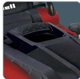
Integrierte Tragegriffe für einfachen Transport