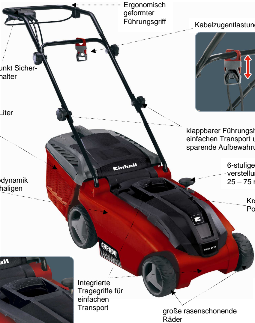
Ergonomisch geformter Führungsgriff