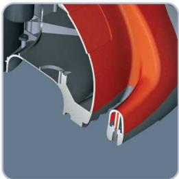
perfekte Aerodynamik durch zweischaligen Aufbau