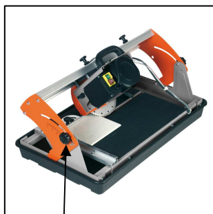
Motorführung von 0° - 45° stufenlos schwenkbar