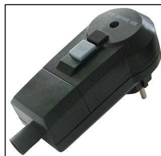
RCD-Stecker für Gerätesicherheit