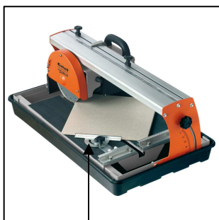
gradgenau einstellbarer Winkelanschlag für exakte Schnitte