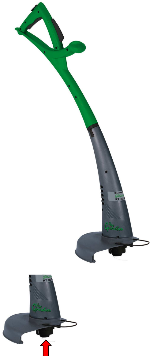
Tipp-Automatik zur Fadennachführung

Besonders komfortabel ist die Tipp-Automatik zur Fadennachführung und die platz sparende Aufmachung.