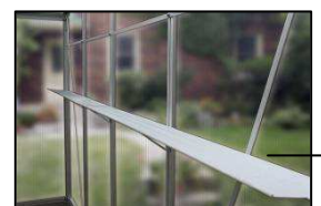
Bild zeigt Gewächshaus RUBIN 3

Abbildungen können nicht im Serien-Lieferumfang enthaltenes Zubehör darstellen / Illustrations can contain accessories, which are not included in standard extent of delivery.