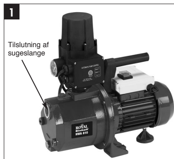
Tilslutning af sugeslange

Vi anbefaler at bruge et forfilter samt et sugesæt med sugeslange, sugeskurv og kontraventil for således at undgå lange ansugningsventetider samt unødvendige beskadigelser af pumpen på grund af sten eller andre faste fremmedlegemer.