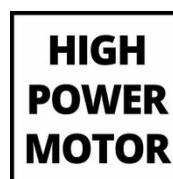
HIGH POWER MOTOR