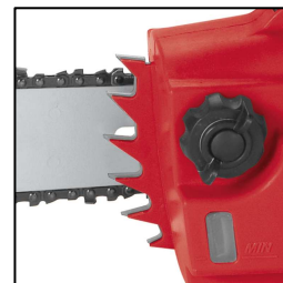
Robuster Krallenanschlag aus Metall