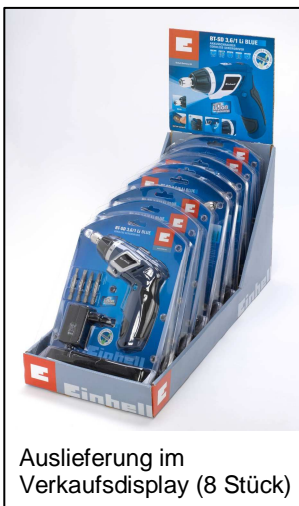
Auslieferung im Verkaufsdisplay (8 Stück)