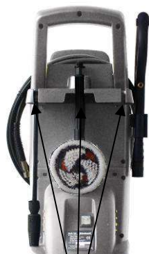
Halterungen für Zubehör