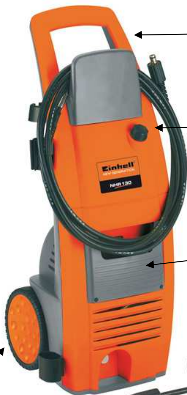
Handgriff für einfachen Transport