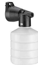
SHAMPOO TANK 0,3 L