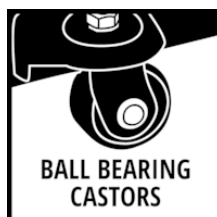
BALL BEARING CASTORS