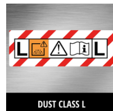
DUST CLASS L