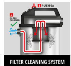
FILTER CLEANING SYSTEM