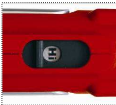
2-Gang Getriebe mit Auto-Lock