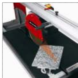
Guida regolabile su scala di precisione