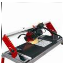
Guida motore inclinabile da 0°-45°