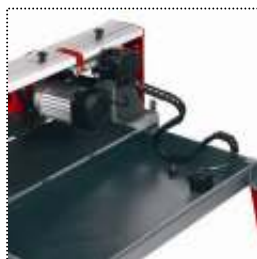
Vasca raccogli acqua con pompa di raffreddamento integrata