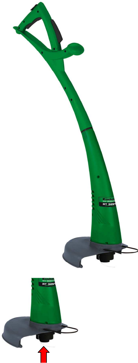
Tipp-Automatik zur Fadennachführung

Für den Rasenschnitt an Problemzonen, wie beispielsweise an Zäunen, Mauern, unter Büschen - überall dort also, wo der Rasenmäher nicht hinkommt oder das Gras zu hoch ist. Mit dem kräftigen 350 Watt-Motor ist der Rasentrimmer ein praktischer Helfer im Garten. Der rotierende Nylonfaden schneidet sauber wie ein Messer.