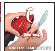
TOOLLESS BLADE CHANGE