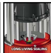
LONG LIVING SEALING