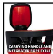
CARRYING HANDLE AND INTEGRATED ROPE EYELET