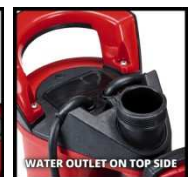
WATER OUTLET ON TOP SIDE