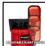
ADJUSTABLE FLOAT SWITCH