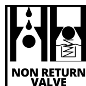
NON RETURN VALVE