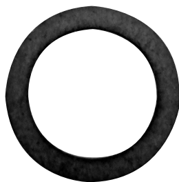
Fig. 2 – Foto do adaptador (bucha de redução)