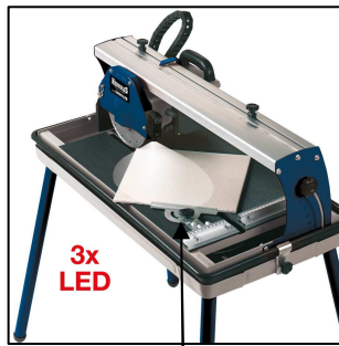
Winkelanschlag mit Gradeinteilung für exakte Schnitte