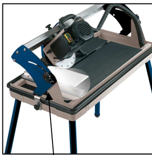
Motorführung von 0°- 45° stufenlos schwenkbar