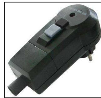
RCD-Stecker für Gerätesicherheit