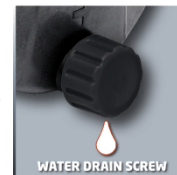
WATER DRAIN SCREW