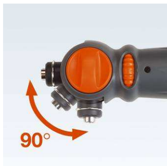
90° stufenlos verstellbarer Getriebekopf