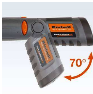
70° drehbarer Handgriff