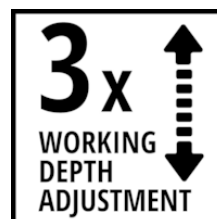
3x WORKING DEPTH ADJUSTMENT