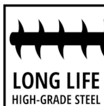
LONG LIFE HIGH-GRADE STEEL