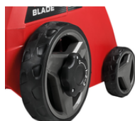
LAWN PROTECTING WHEELS