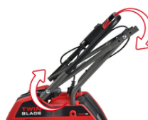
FOLDABLE HANDLE BAR