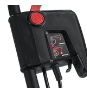
CABLE STRAIN RELIEF