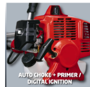
AUTO CHOKE + PRIMER / DIGITAL IGNITION