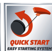
QUICK START EASY STARTING SYSTEM