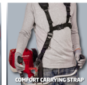
COMFORT CARRYING STRAP