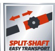
SPLIT-SHAFT EASY TRANSPORT