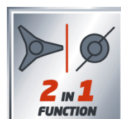
2 IN 1 FUNCTION