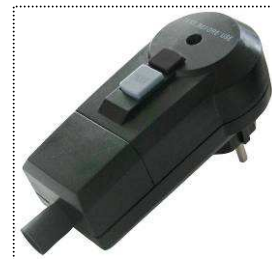
RCD-Stecker für Gerätesicherheit