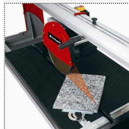
gradgenau einstellbarer Winkelanschlag für exakte Schnitte