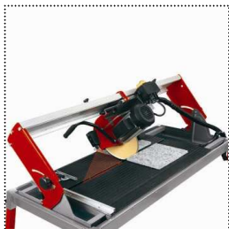
stufenlos schwenkbare Motorführung von 0°-45°