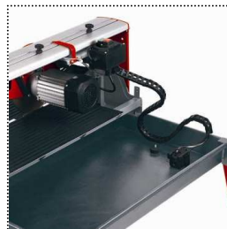
Wasserauffangwanne mit integrierter Pumpe zur Kühlwasserförderung und Ablassstößel