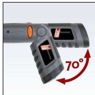
70° drehbarer Handgriff

Der P-NGS 4.8 ist die optimale, handliche Lösung für jeden Heimwerker. Der stufenlos verstellbare Getriebekopf mit hochwertigem Metallgetriebe hebt den Akku-Stabschrauber deutlich von vergleichbaren Mitbewerbern ab. Mit dem drehbaren Handgriff kann auch an schwer zugänglichen Stellen problemlos gearbeitet werden.