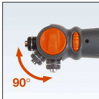
90° stufenlos verstellbarer Getriebekopf