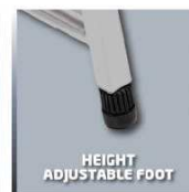
HEIGHT ADJUSTABLE FOOT