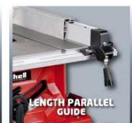
LENGTH PARALLEL GUIDE