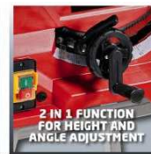
2 IN 1 FUNCTION FOR HEIGHT AND ANGLE ADJUSTMENT