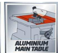
ALUMINIUM MAIN TABLE