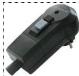
Presenza di sicurezza RCD