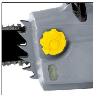
Ölbehälter mit Schauglas