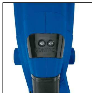
LED-Anzeige für Betrieb Überlastschutz