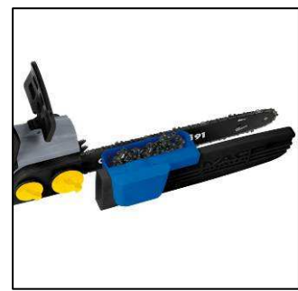
Schwertschutz mit Universalbehälter