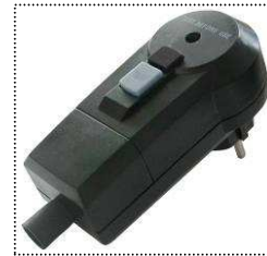
RCD-Stecker für Gerätesicherheit