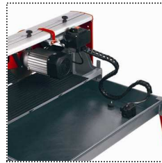
Wasserauffangwanne mit integrierter Pumpe zur Kühlwasserförderung und Ablassstößel