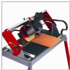
stufenlos schwenkbare Motorführung von 0°-45°