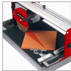
gradgenau einstellbarer Winkelanschlag für exakte Schnitte